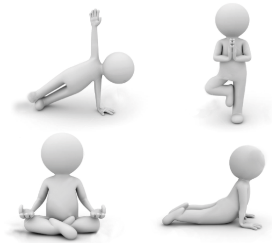
Mieux bouger, se relaxer